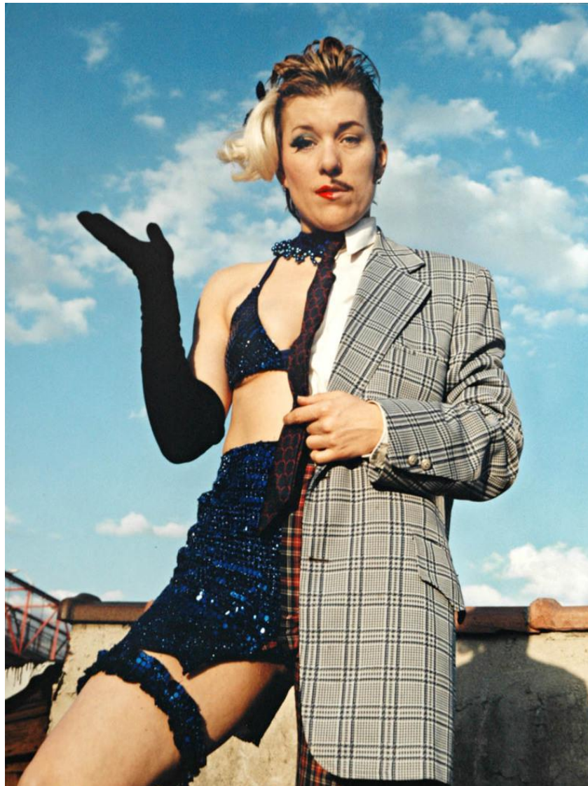
« Mo B Dick, Half & Half », 1998, Del LaGrace Volcano.